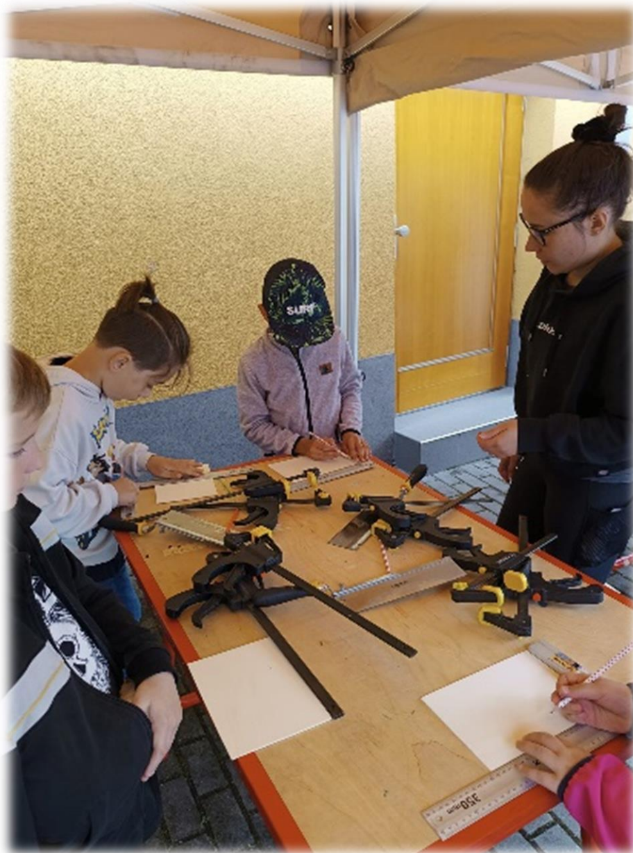
9.6. Sportovní den Sedlec